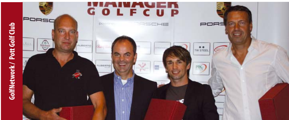
GolfNetwork / Pott Golf Club