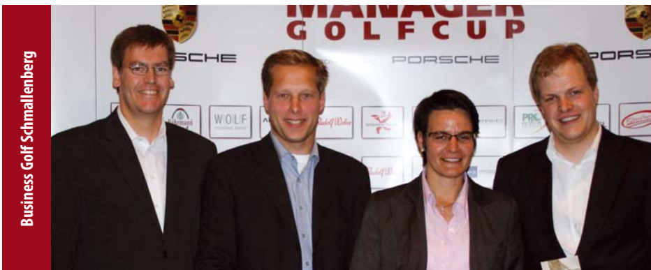
Business Golf Schmallenberg