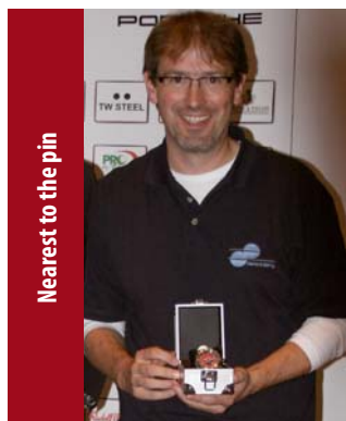
Nearest to the pin